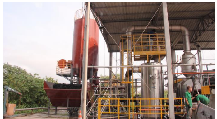
Kläranlage Barueri/SP, Sabesp