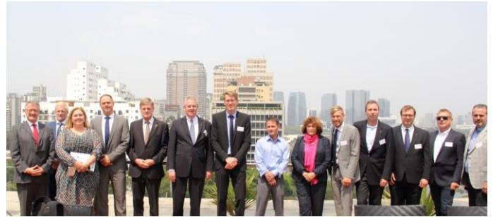
São Paulo, Delegation