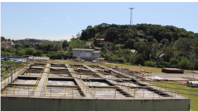
Kläranlage Blumenau/SC, Odebrecht Ambiental