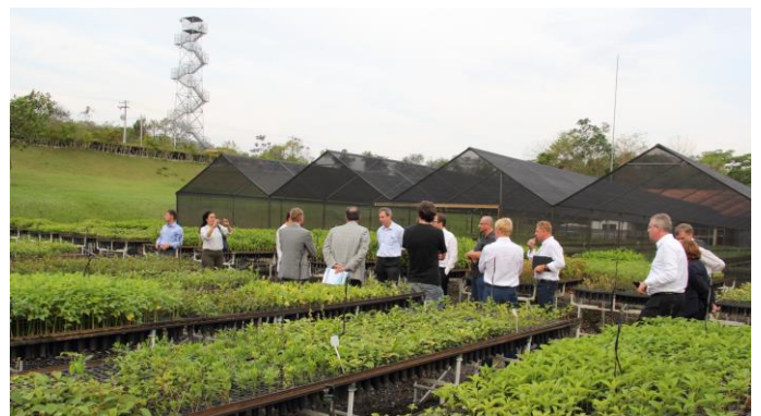
SOS Mata Atlantica, Itu/SP