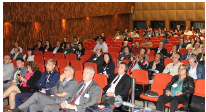
Symposium am 19.09.2016 in São Paulo