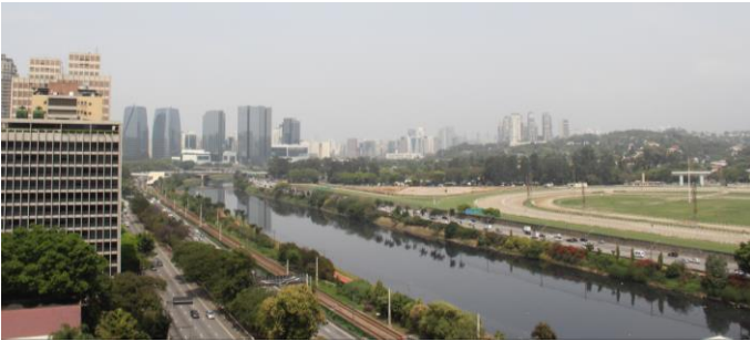
São Paulo, Blick auf den Rio Pinheiros