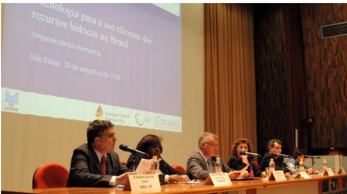
Symposium am 19.09.2016 in São Paulo