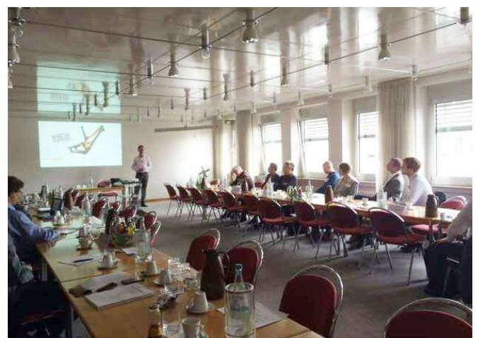
Informationsveranstaltung Taiwan am 14. Juni 2016 in Köln

26 Unternehmensvertreter und Fachreferenten tauschten sich am 14. Juni 2016 in Köln zu den Geschäftschancen in Taiwan für kleine und mittlere Unternehmen (KMU) aus. In vertiefenden Vorträgen taiwanischer und deutscher Branchen- und Länderexperten, bei anregenden Diskussionen sowie in Einzel- und Networking-Gesprächen konnten sich die Teilnehmer der Informationsveranstaltung ein Bild über die aktuellen Entwicklungen und Chancen für die deutsche Kreativwirtschaft in Taiwan machen. DEinternational Taiwan Ltd. (AHK Taiwan) hatte die Veranstaltung im Auftrag des Bundesministeriums für Wirtschaft und Energie im Rahmen des BMWi-Markterschließungsprogramms organisiert. Teilnehmer waren vorwiegend Inhaber von deutschen Industriedesignbüros sowie Mitarbeiter von Unternehmen aus dem produzierenden Gewerbe und Dienstleistungssektor, Universitätsprofessoren sowie Vertreter deutscher und taiwanischer Behörden.